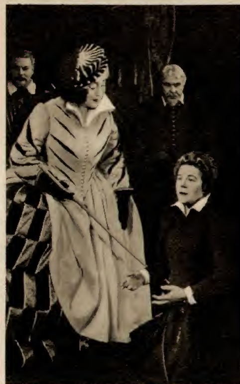
Käthe Dorsch als Elisabeth (links) und Paula Wessely als Maria Stuart in der Burgtheater-Inszenierung

KÄTHE DORSCH spielt am 6. I. die Elisabeth in Schillers „Maria Stuart“